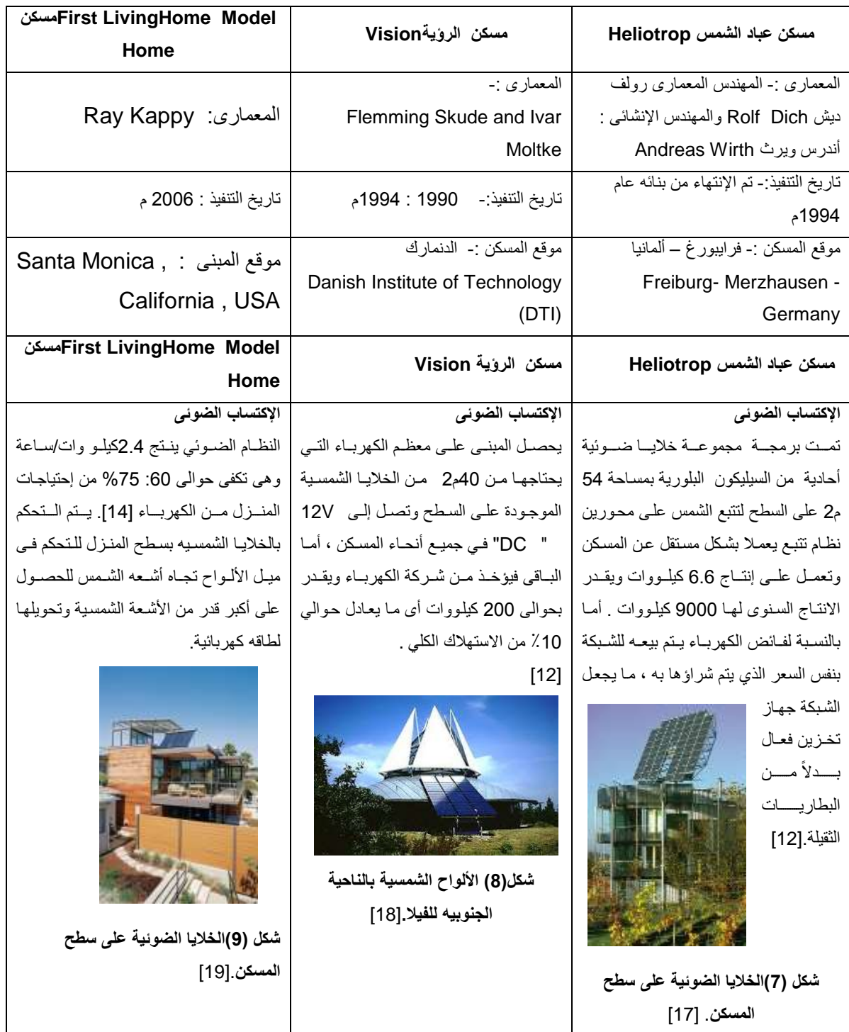
جدول ( 1 ) يوضح بعض الامثلة لمباني سكنية تحتوى على نظام الطاقة الشمسية