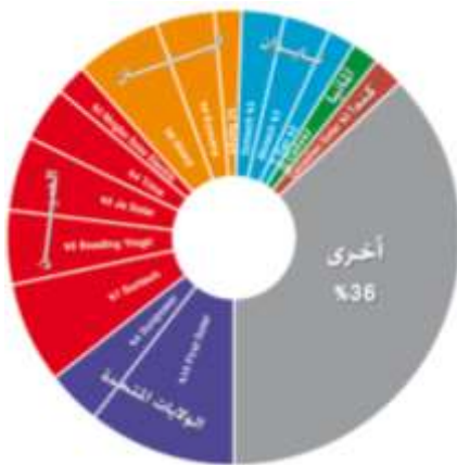
شكل (2) يوضح أكبر شركات إنتاج الخلايا الشمسية حسب جنسياتها وحصتها من السوق حسب تقرير العالمي الخاص بالطاقة المتجددة والصادر REN21 عام 2010 (المستقبل، 2011، صفحة 17).

28% منذ عام 2005، ما وضعها في مصاف الدول الرائدة في مجال تطوير الشبكة الكهربائية الذكية (Smart Grid). أكثر من 100 دولة أقرت، مؤخراً، استراتيجيات محلية تفرض الاعتماد على خيار الطاقة المتجددة، مقارنة بعام 2005، حين لم تكن سوى 55 دولة قد أقرت مثل هذه السياسات، أسهم ذلك في انخفاض تكلفة صناعة تلك المواد والمعدات والتي نتج عنه انخفاض تكلفة إنتاج الطاقة المتجددة وانتشار استخدامها على نحو أوسع كما بالشكل رقم (2). [13]